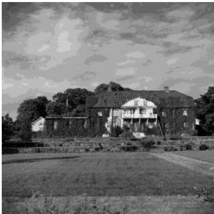
Jätsberg från trädgårdssidan med grusade trädgårdsgångar och kantrabatter.

Trädgården och parken har förenklats och rationaliserats i jämförelse med det tidiga 1900-talet. De rabatter och planteringar som kan urskiljas på foton från mitten av 1900-talet är numera igenlagda. I andra delar har parkmiljön återställts; ett tidigare granplanterat vilthägn vid uppfarten har röjts och nyplanterats med ädellövträd och parkkaraktären återskapats. Den terrasserade parterren mot väster och övriga ytor kring corps-de-logiet, flyglarna och mejeriet sköts fortlöpande som klippta öppna gräsparterrer, och en del äldre fruktträd och prydnadsträd står kvar. Herrgårdskaraktären förstärks av ett värdefullt bestånd av gamla ekar och andra ädellövträd som omger gårdsmiljön.