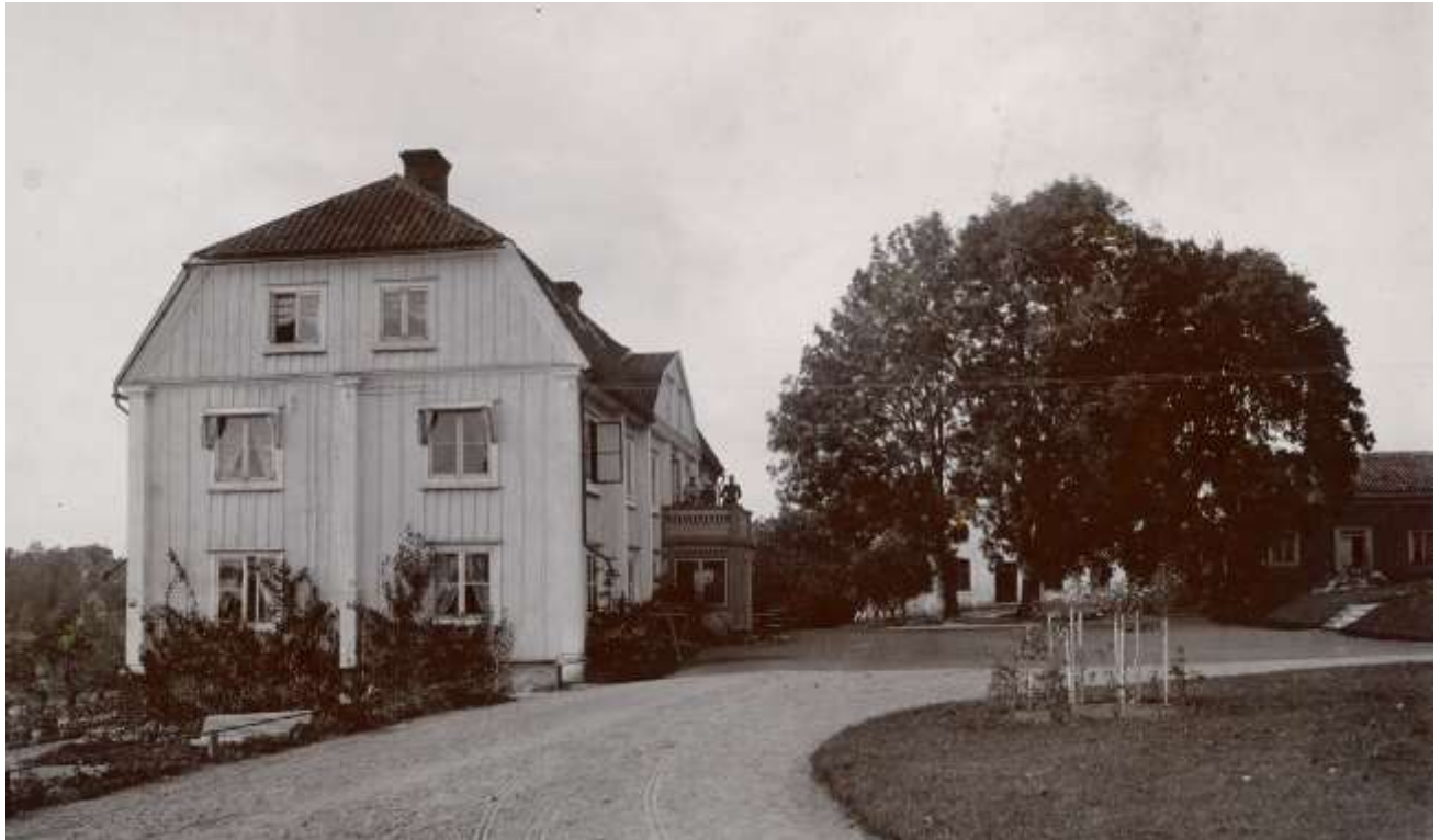
Jätsberg kring sekelskiftet 1900. En veranda med balkong tillkom under 1800-tales senare del. Vålansade rabatter och planteringar inramar gårdsbyggnaderna.