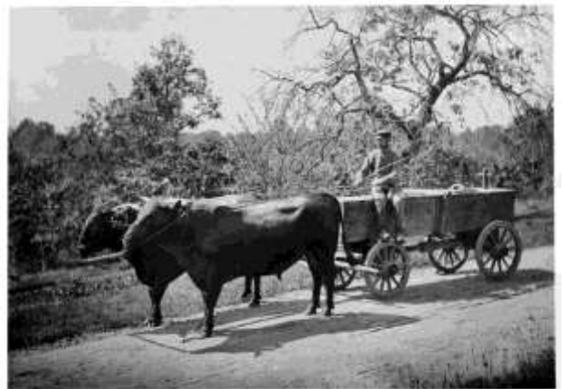
Oxarna förspända på Jätsberg. Omkr 1900

Utvecklingen av lantbruket fortsatte och Jätsberg ansågs vid 1900-talets början som en av de främsta jordegendomarna i länet. 18 Kreatursbesättningen uppgick till 180 kor samt oxar och ungdjur. Gårdsmejeriet moderniserades tidigt med separatorer och ångmaskinsdrift, men med järnvägslinjen Växjö-Tingsryd 1897 kunde