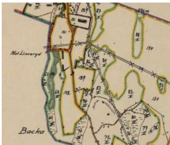
Detalj av karta 1923 över Ljuders prästgård, Ljuder n:1. Kyrkstallarna är här återgivna med en byggnadssymbol mitt i kartan. Här syns den mindre vinkelbyggnaden mot öster.

Sockenstugan fick efter kommunallagarnas införande 1862 även uppgiften som kommunalhus. Idag inrymmer byggnaden, förutom församlingshem, ett så kallat Amerikarum med studiematerial och utställning om emigrationen. Intill sockenstugan ligger de norra kyrkstallarna, en länga med rödfärgad locklistpanel. På en höjd intill kyrkan är Ljuders hembygdsgård, anlagd kring det gamla sockenmagasinet vilket ligger kvar på ursprunglig plats.