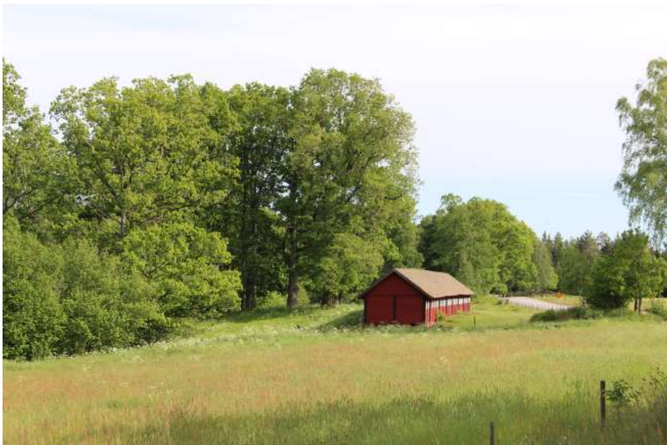
Ljuders södra kyrkstallstallar ligger väl synliga invid landsvägen, omgivna i norr och söder av beteshagar. Framför byggnaden är en gräsbevuxen plan, bakom längan är terrängen mer kuperad med bestånd av kraftiga gamla ekar och askar.