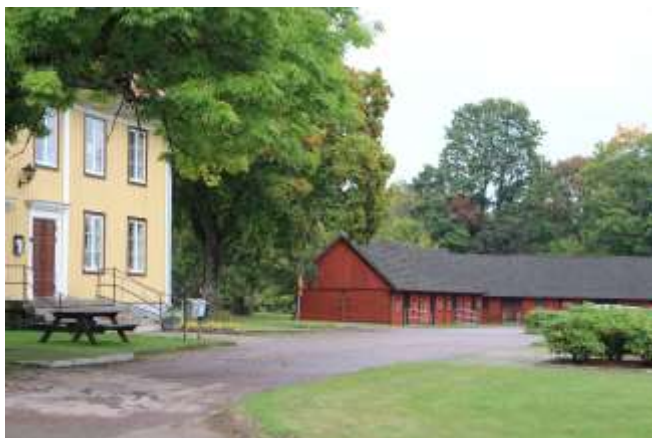
Sockenstugan/kommunalhuset i Linneryd uppfördes 1864. I bakgrunden syns ett av de vinkelbyggda kyrkstallarna från samma tid.

I Jönköpings län finns bevarade kyrkstallar bland annat i socknarna Åker och Villstad. Här hade varje hemman eller by en fristående stallbyggnad, uppförd av liggtimmer. I Villstad är de befintliga stallarna från mitten av 1800-talet. Det har varit många fler norr och söder om kyrkan för de hemman och byar som låg i de riktningarna. Det tycks varit det vanliga fram till slutet av 1800-talet att man byggde fristående stallar, en per gård eller by. I Villstad har det tydligen varit en per by eftersom det finns flera spiltor i varje och varje har namn på gården eller senaste innehavaren som nyttjade spiltan. Underhållet och byggandet var respektive hemmans/bys ansvar. Såldes gården gick även spiltan över till näste ägare. (uppgift av R Gullbrandson, Jönköpings läns museum)