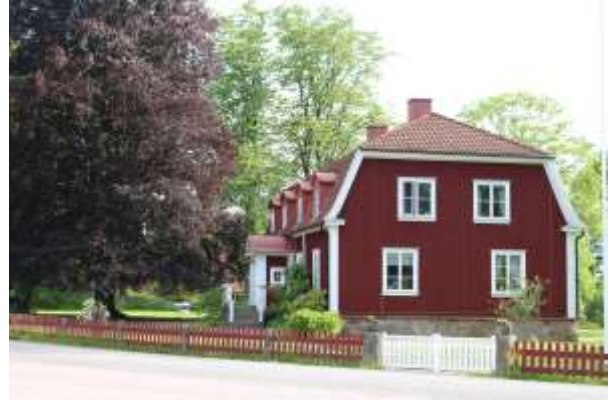
Ovan: Ljuders kyrka, invigd år 1846. Till höger: Ljuders prästgård från samma tid fick sin nuvarande utformning efter ombyggnad 1923