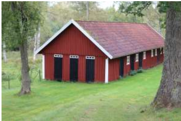
Ovan: Norra kyrkstallarna