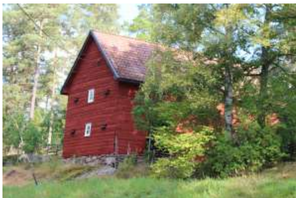
Nedan: sockenmagasinet från 1868 är idag en del av Ljuders hembygdsmuseum